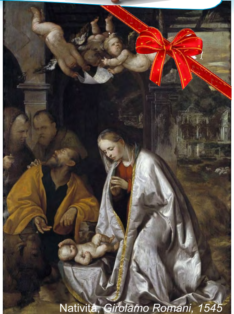
Natività, Girolamo Romani, 1545

O Signore, nostro Dio, quanto è grande il tuo nome su tutta la terra.