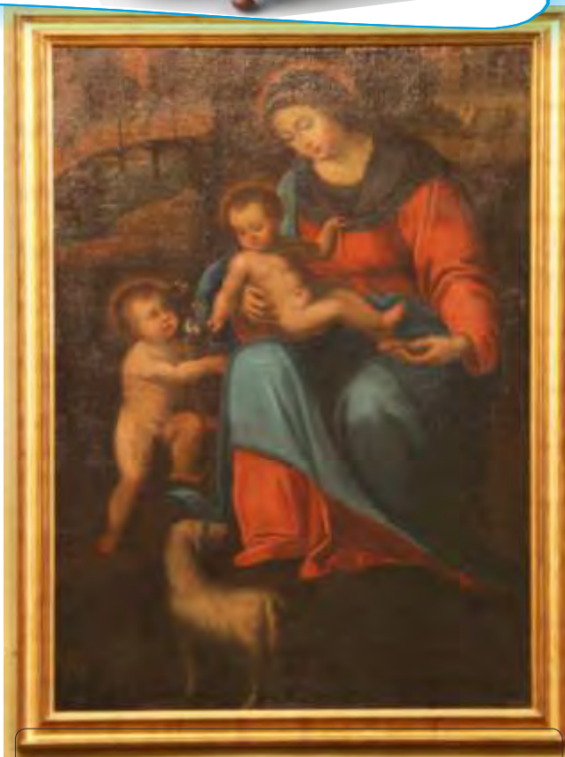
quadro: Madonna col Bambino e san Giovanni bambino collocato nella navata centrale della nostra chiesa, a sinistra, sopra l'uscita con porta automatica

Inoltre fra i nomi maschili, ma anche usato nelle derivazioni femminili (Giovanna, Gianna) è il più diffuso nel mondo, tradotto nelle varie lingue; e tanti altri santi, beati, venerabili della Chiesa, hanno portato originariamente il suo nome; come del resto il quasi contemporaneo s. Giovanni l'Evangelista e apostolo, perché il nome Giovanni, al suo tempo era già conosciuto e nell'ebraico lehóhanan, significava: "Dio è propizio".